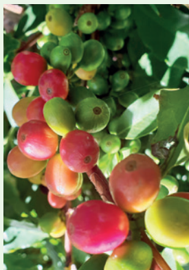
Diese Kaffeekirschen liefern den Kaffee für unsere Chi-Cafes.